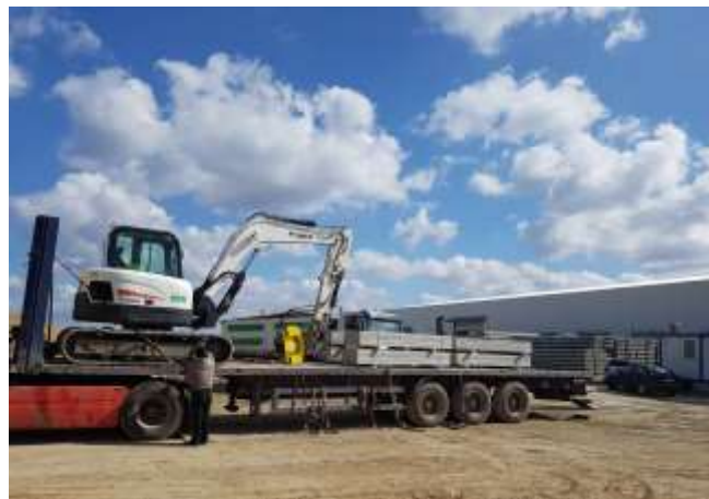
Transportarea stâlpilor pentru instalare

Deasemenea oferim toate accesoriile necesare pentru înființarea unei livezi sau vii superintensive, proiectăm și efectuăm toate lucrările.