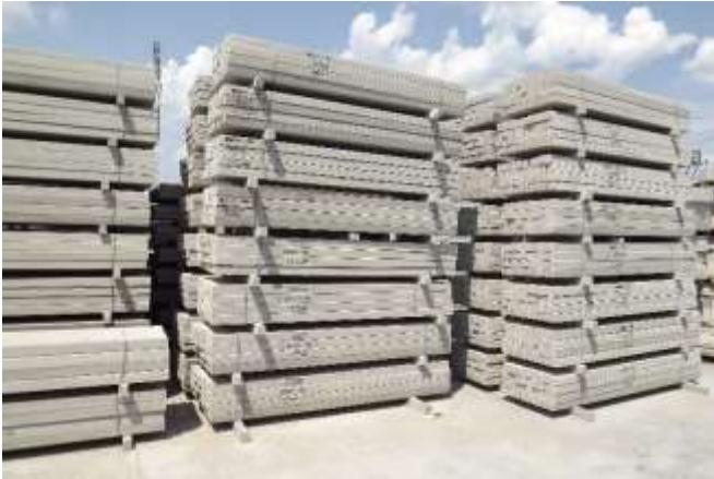
Pentru vii și livezi