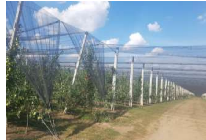
Livadă superintensivă finisată