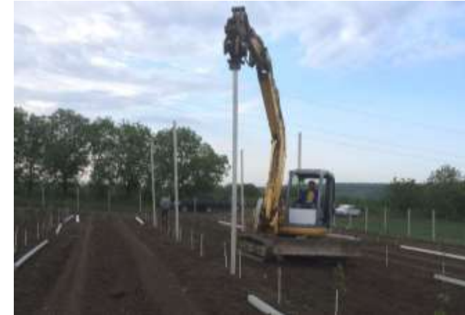
Instalarea stâlpilor folosind sistemul GPS

Deasemenea oferim toate accesoriile necesare pentru înființarea unei livezi sau vii superintensive, proiectăm și efectuăm toate lucrările.